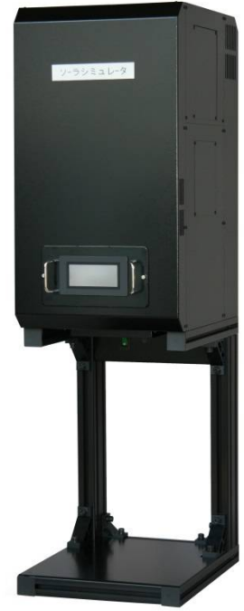
【タッチパネル拡大図】